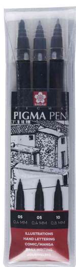
Faserschreiber PIGMA PEN, 3er Etui