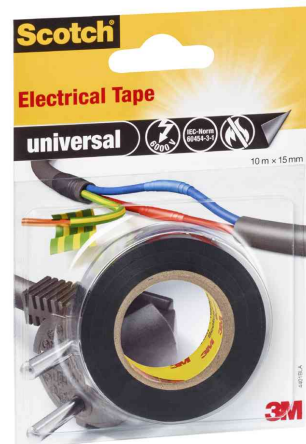
Isolierband universal, schwarz