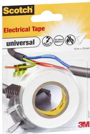
Isolierband universal, weiß