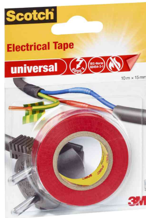
Isolierband universal, rot