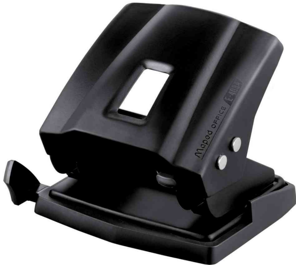
Locher Essentials E4034