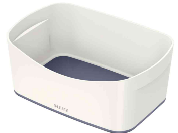
Utensilienschale My Box, weiß / grau