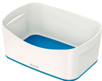
Utensilienschale My Box, weiß / blau