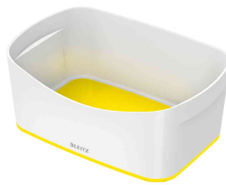
Utensilienschale My Box, weiß / gelb