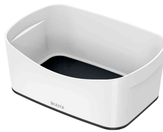
Utensilienschale My Box, weiß / schwarz