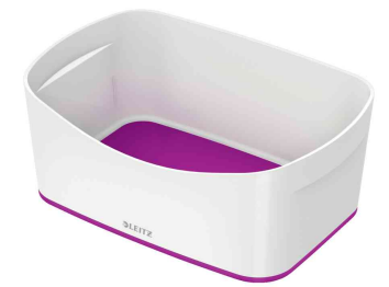
Utensilienschale My Box, weiß / violett