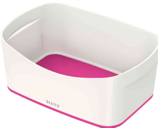
Utensilienschale My Box, weiß / pink