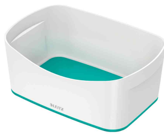
Utensilienschale My Box, weiß / eisblau