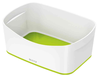
Utensilienschale My Box, weiß / grün