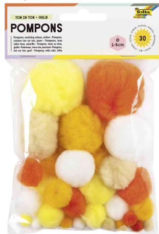
TON IN TON MIX gelb