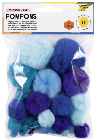
TON IN TON MIX blau