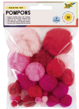
TON IN TON MIX rot