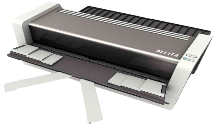
Laminiergerät iLam Touch 2 Turbo A3, mit ausgeklappten Ablagefächern