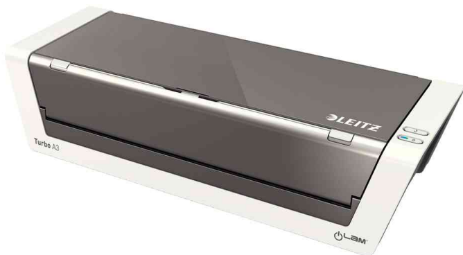
Laminiergerät iLam Touch 2 Turbo A3, geschlossen