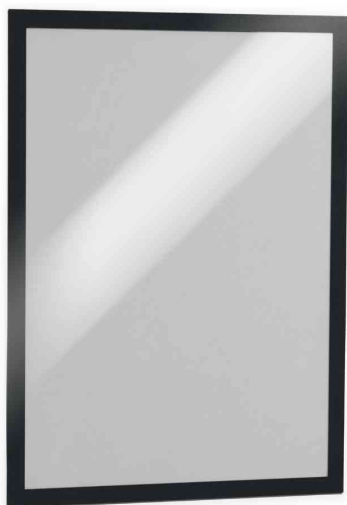
Magnetrahmen DURAFRAME, schwarz