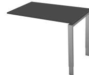
Zubehör: Anbau-Schreibtisch "Form 5", anthrazit N:\VivalP\Koeffe\61985\4164.jpg