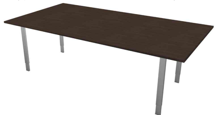
Konferenztisch "Form 5", wenge