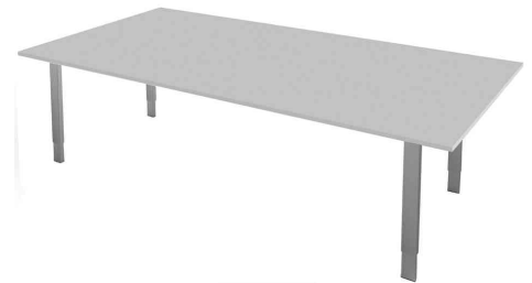
Konferenztisch "Form 5", lichtgrau