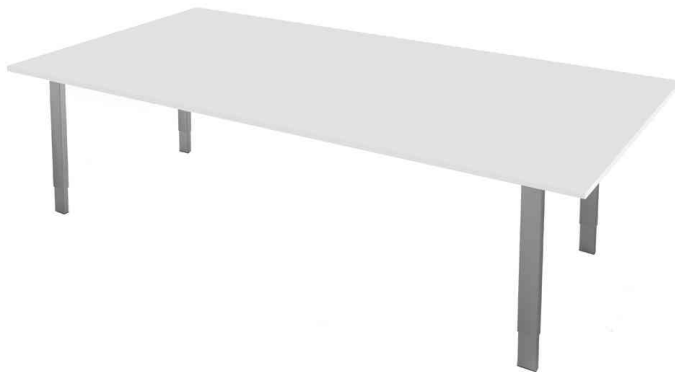
Konferenztisch "Form 5", weiß