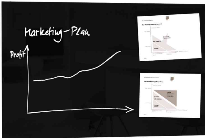
Glas-Magnettafel "artverum", schwarz