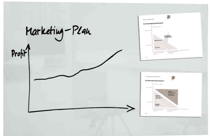
Glas-Magnettafel "artverum", weiß