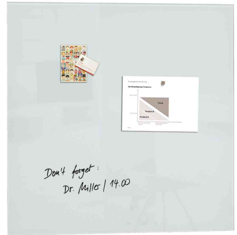
Glas-Magnettafel "artverum", weiß