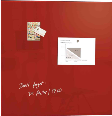
Glas-Magnettafel "artverum", rot