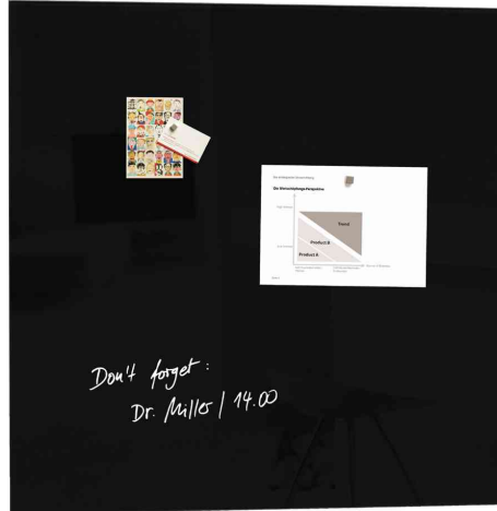
Glas-Magnettafel "artverum", schwarz