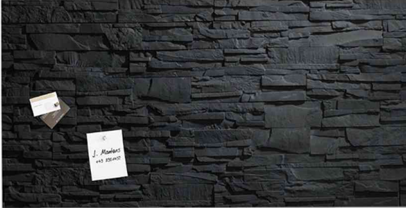
Glas-Magnettafel "artverum", Schiefer-Stein