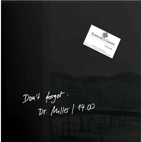
Glas-Magnettafel "artverum" Colour, schwarz