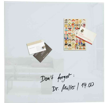
Glas-Magnettafel "artverum" Colour, weiß