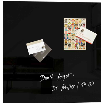
Glas-Magnettafel "artverum" Colour, schwarz