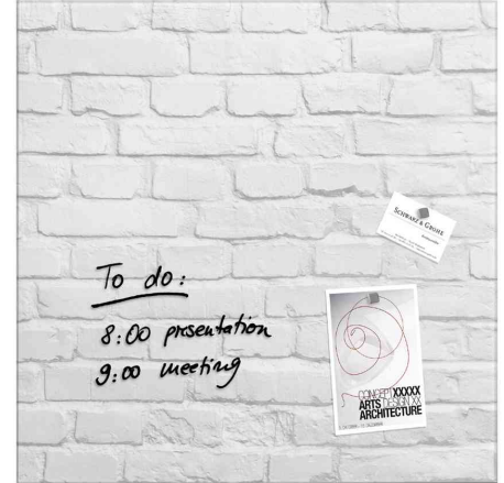
Glas-Magnettafel "artverum" Design, White-Klinker