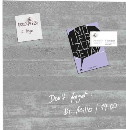
Glas-Magnettafel "artverum" Design, Sichtbeton