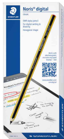
Eingabestift / Bleistift Noris digital, in Kartonfaltschachtel