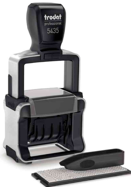
Datumstempel Professional 4.0 Typomatic 5435

- ideal wenn Texte öfter geändert werden