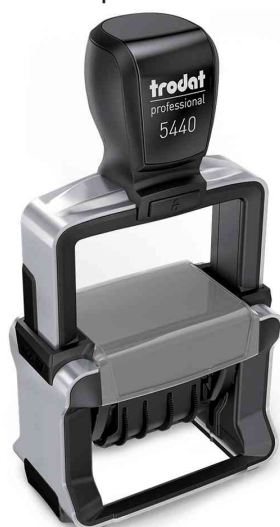
Datumsstempel Professional 4.0 5440/L

Zubehör: Ersatzstempelkissen: auf Blisterkarte, Abgabe nur in ganzen VE's