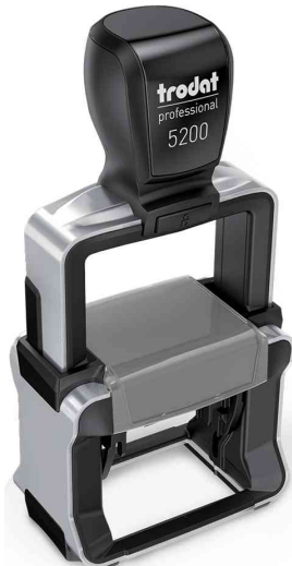
Textstempel Professional 4.0 5200

Zubehör: Ersatzstempelkissen: Abgabe nur in ganzen VE's