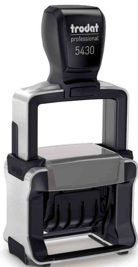
Datumstempel Professional 4.0 5430

Zubehör: Ersatzstempelkissen: VE = 2 Stück auf Blisterkarte, Abgabe nur in ganzen VE's