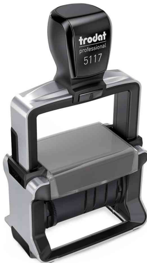
Wortbandstempel Professional 4.0 5117

Zubehör: Ersatzstempelkissen: auf Blisterkarte, Abgabe nur in ganzen VE's