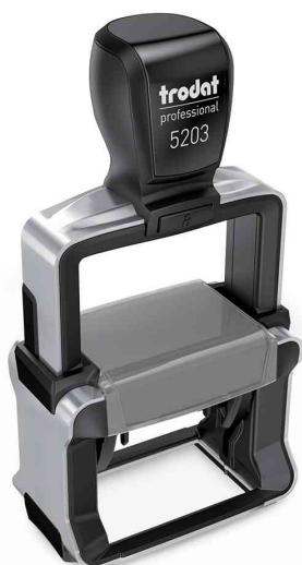
Textstempel Professional 4.0 5203

Zubehör: Ersatzstempelkissen: Abgabe nur in ganzen VE's