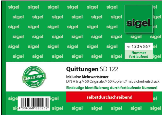
Formularbuch Quittungen inkl. Mehrwertsteuer

- einsetzbar für sogenannte Kleinbetragsrechnungen im Wert unter 150 € Brutto