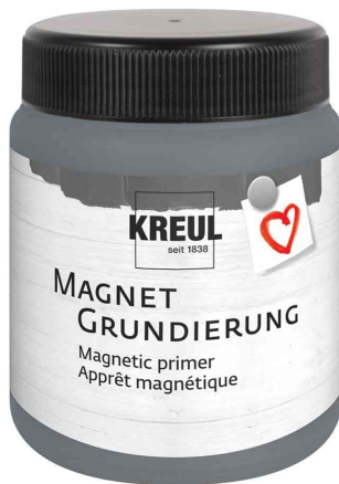
Magnetgrundierung, 250 ml