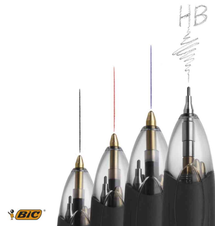
Mehrfarb-Kugelschreiber & Bleistift in einem