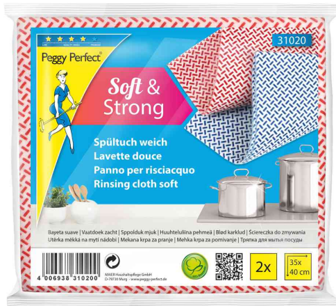
Spültuch, 2er Pack