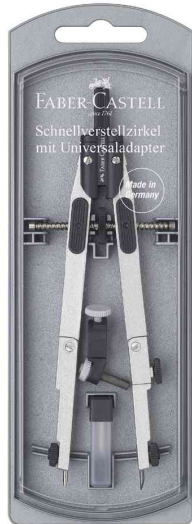
Schnellverstellzirkel, silber / schwarz