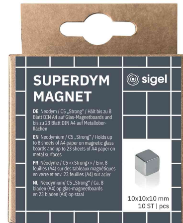
Neodym-Würfelmagnet "Strong" C5, 10er Set