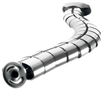
Kabelbündler mit Standfuß