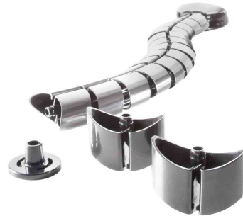
Detailansicht der Gelenke