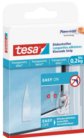
Powerstrips® Klebestreifen, spitz