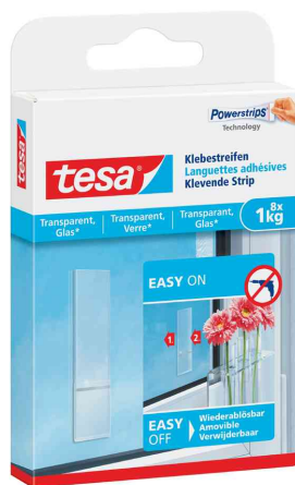
Powerstrips® Klebestreifen, rechteckig