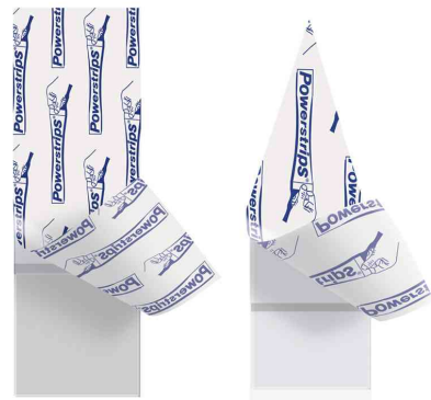
Powerstrips® Klebestreifen für Glas & Kunststoff