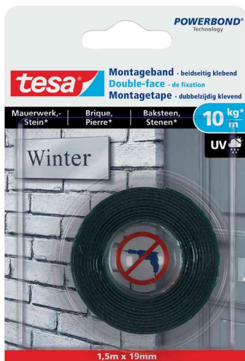
Powerbond® Montageband für Mauerwerk & Stein, 1,5 m