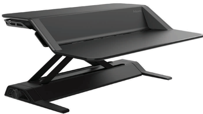
Sitz-Steh Workstation Lotus