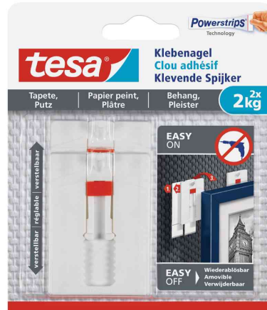
Powerstrips® Klebenagel - für Tapeten & Putz, 2 x 2 kg