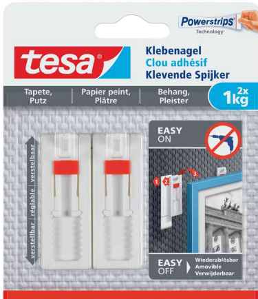
Powerstrips® Klebenagel - für Tapeten & Putz, 2 x 1 kg