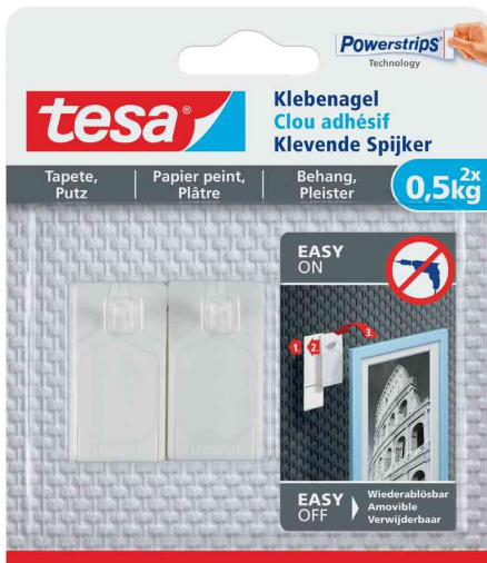
Powerstrips® Klebenagel - für Tapete & Putz, 2 x 0,5 kg