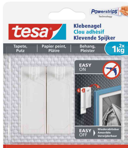
Powerstrips® Klebenagel - für Tapete & Putz, 2 x 1 kg