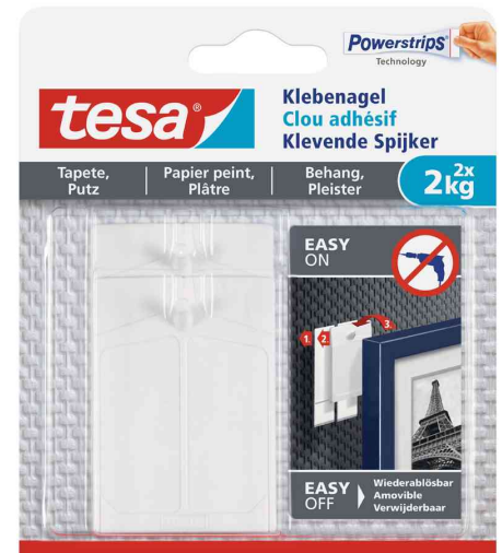
Powerstrips® Klebenagel - für Tapete & Putz, 2 x 2 kg