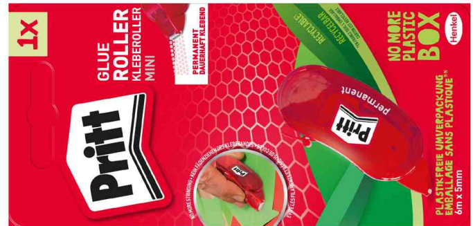
Kleberoller Mini, auf Blisterkarte