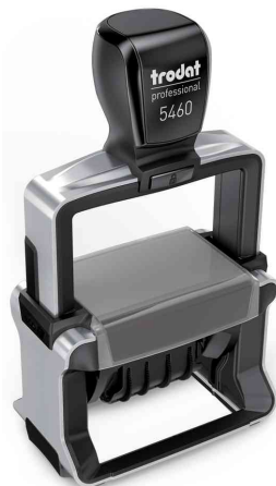
Datumstempel Professional 4.0 5460

Zubehör: Ersatzstempelkissen: auf Blisterkarte, Abgabe nur in ganzen VE's