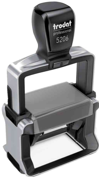
Textstempel Professional 4.0 5206

Zubehör: Ersatzstempelkissen: Abgabe nur in ganzen VE's