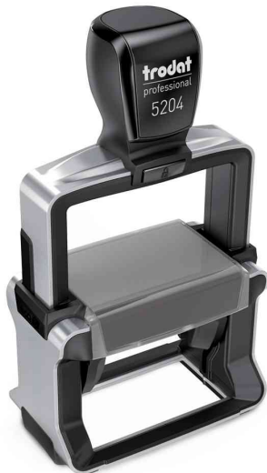
Textstempel Professional 4.0 5204

Zubehör: Ersatzstempelkissen: Abgabe nur in ganzen VE's