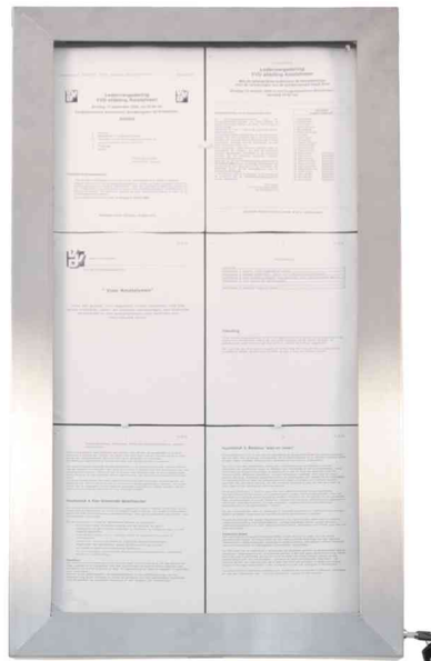
LED-Schaukasten STAINLESS STEEL, 6x DIN A4