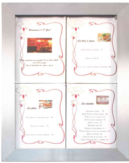
LED-Schaukasten STAINLESS STEEL, 4x DIN A4

- zur Präsentation von Speisen- und Getränkeauswahl im Außen- und Innenbereich