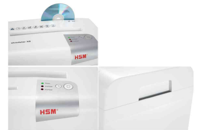
Details: Separates CD-Schneidwerk - Bedienelement - abnehmbares Oberteil