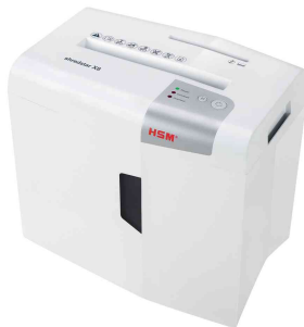
Aktenvernichter HSM shredstar X8