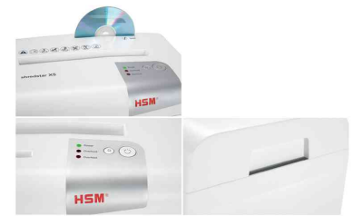
Details: Separates CD-Schneidwerk - Bedienelement - abnehmbares Oberteil