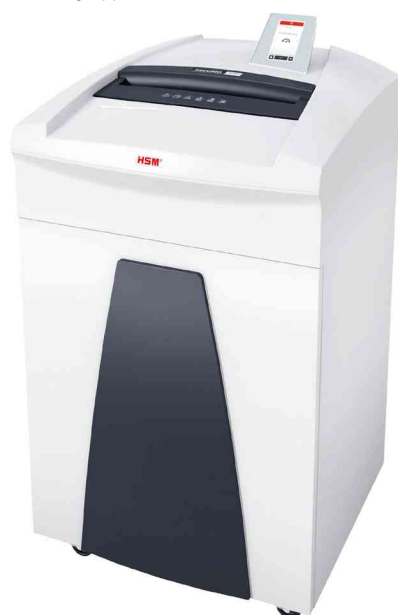
Aktenvernichter SECURIO P36i

- perfekt für große Arbeitsgruppen mit bis zu 15 Personen