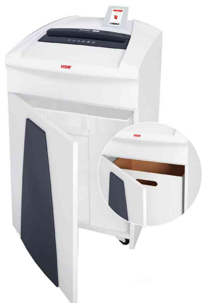
Detailansicht: Unterschrank mit Tür