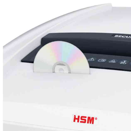
Detailansicht: Separates CD-Schneidwerk