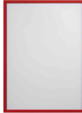
Sichttasche FRAME IT X-tra!Line, rot