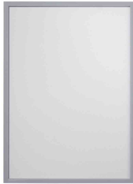
Sichttasche FRAME IT X-tra!Line, grau