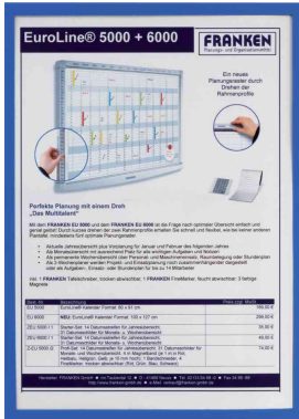
Sichttasche FRAME IT X-tra!Line, blau