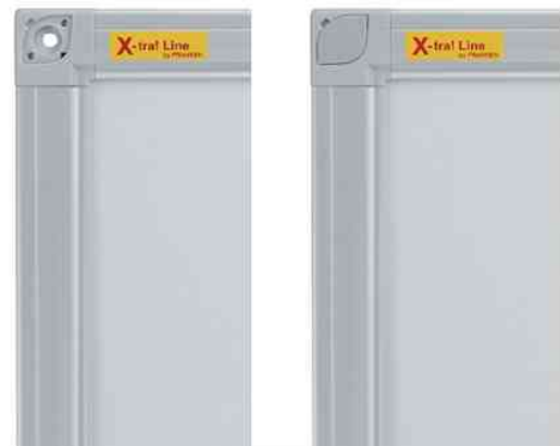
Verbessertes Rahmenprofil mit verdeckter Montagmöglichkeit