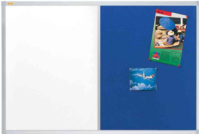
Kombitafel X-tra!Line Filz, blau

- die ideale Tafel für das Anheften von Fotos, Memos und für kurzfristige Notizen