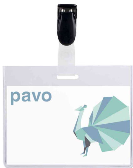
Namensschild, oben geschlossen, mit Clip