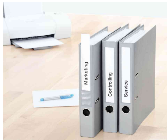
Zeigt das Produkt in der Anwendung