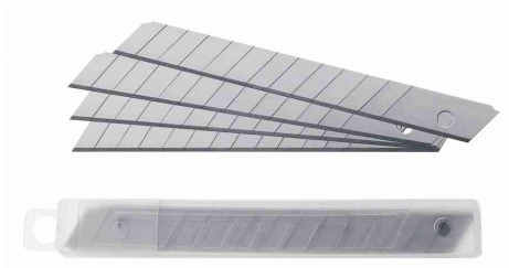
Zubehör: Ersatzklingen für Cutter E-84000, E-84001, E-84002, E-84021, E-84024, E-84027