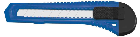
Cutter Office, 18 mm, blau / schwarz