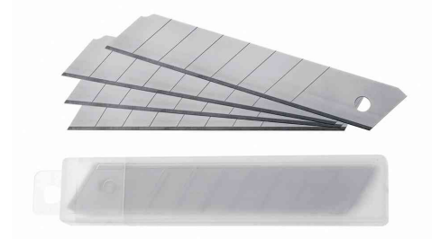
Zubehör: Ersatzklingen für Cutter E-84003, E-84004, E-84005, E-84006, E-84025, E-84028