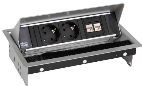
Steckdoseneinheit "CONI", 3-fach - im Bundle