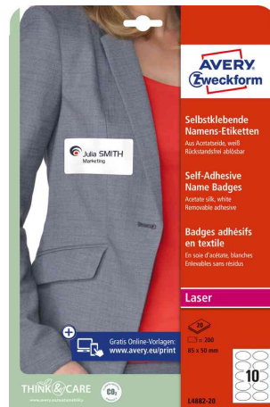
Namensetiketten - oval